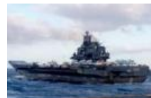
“沈阳舰”航空母舰姊妹舰现状