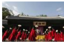
韩国举行“秋期释奠大祭”