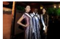
世界模特嘉年华 60佳丽夜游杜甫草堂