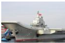
世界各国航母大对比