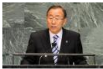
第67届联大一般性辩论开