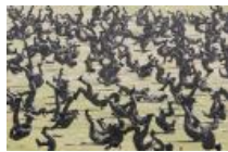
韩国举行建军节纪念仪式